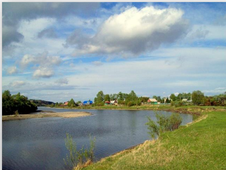
Село Баклаши, где родился генерал Белобородов

Родился 18 (31) января 1903 года в деревне Акинино-Баклаши Иркутской губернии (ныне село Баклаши Шелеховского района Иркутской области) в казачьей семье. Окончил 3 класса сельской школы.