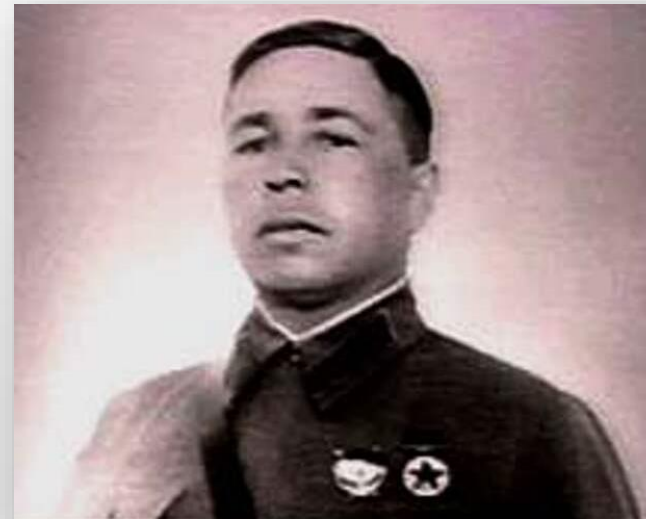
Военная Академия имени Фрунзе

После завершения боевых действий был назначен командиром команды одногодичников в том же полку. В 1933 году поступил в Военную академию РККА им. Фрунзе, окончил её в 1936 году (специальный факультет с обучением японскому и английскому языкам). В том же году ему было присвоено воинское звание старший лейтенант. С ноября 1936 года — помощник начальника и начальник оперативной части штаба 66-й стрелковой дивизии в Приморском крае. С марта 1939 года — начальник оперативного отдела штаба 39-го стрелкового корпуса. С июня 1939 — начальник штаба 43-го стрелкового корпуса, с ноября временно исполнял должность командира корпуса. С января 1941 года — начальник отдела боевой подготовки штаба Дальневосточного фронта.